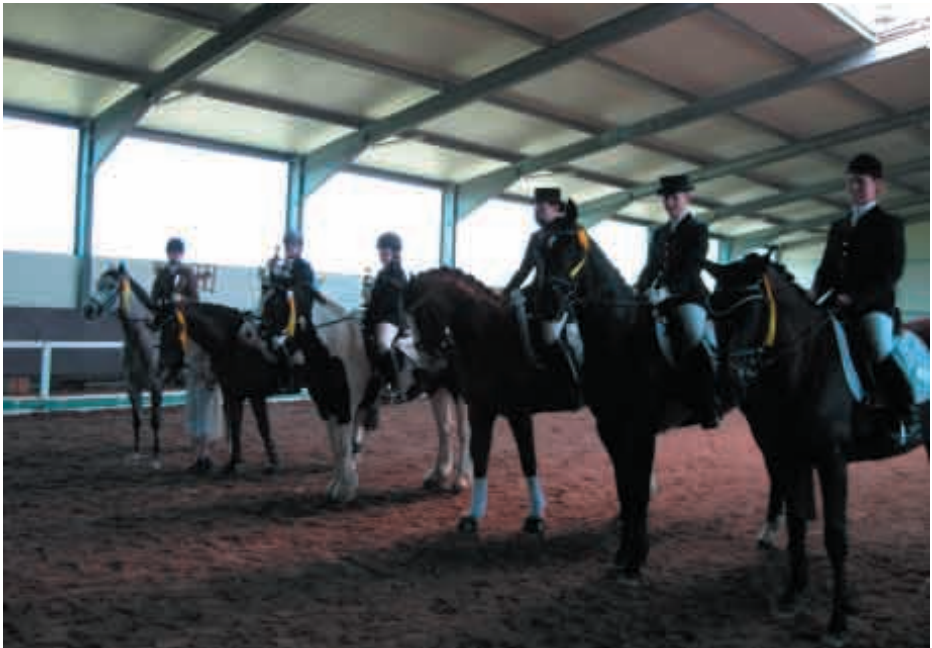
Vereinsmeister & Pokalsieger 2008